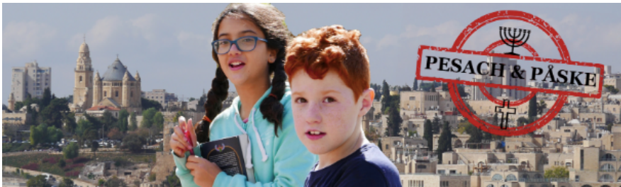
Billedudsnit fra projektets hjemmeside

I små film fortæller børn til børn om, hvordan de fejrer pesach og påske.